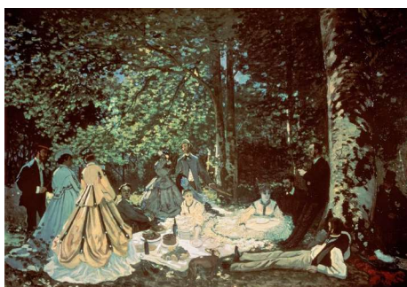
Claude Monet (1840-1926), étude pour Le Déjeuner sur l'herbe , Moscou, musée des Beaux-Arts Pouchkine